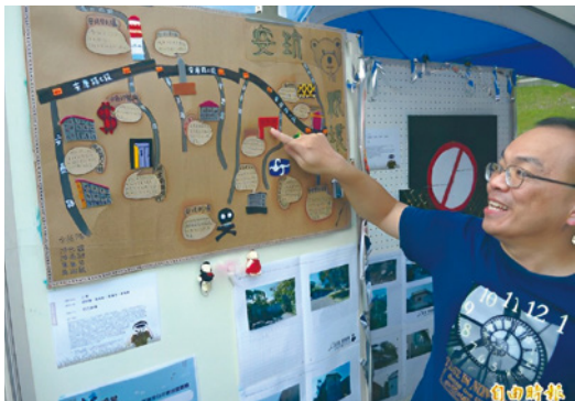
圖 7 新店溪遊記市集中繪製者解說現場（資料來源：自由時報）。

一環。部份參與者不僅展示最終完成版社區地圖，亦將繪製中的未完成草圖第一版、第二版也呈現，不僅展示「成果」也展示「過程」。並由繪製者於市集中向參觀者解說社區地圖的內容及經驗。將市集活動作為「展示」與「溝通」的平台，讓繪製者與參觀者藉由地圖開啟在地對話及交流。