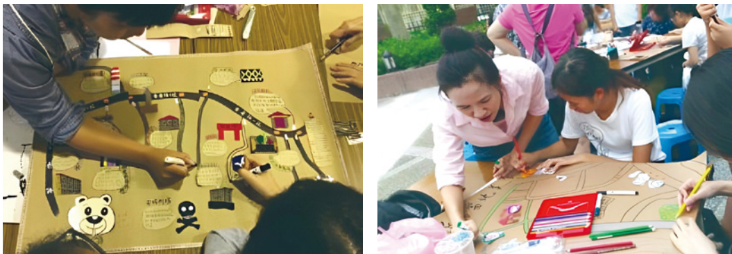
圖 2、3 社區地圖繪製情形。