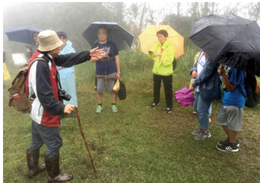
圖6 「勇闖·獅仔頭山土匪窟」走讀現場。