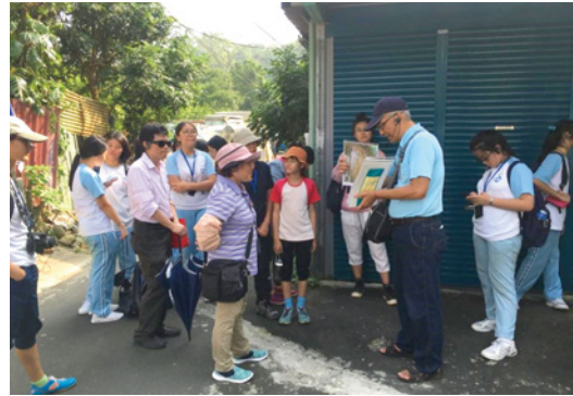
圖4 「看見·記者眼中的安坑！」走讀現場。