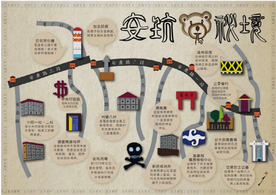
圖 10 「安坑秘境」社區地圖（資料來源：新北市新店區公所 https://www.xindian.ntpc.gov.tw/ ）。

地圖所標示的地點，依地圖上的編號依序包括：溪州部落、立委眷村、台大安康農場、空軍烈士公墓、氣象局儀器檢校中心、清風園、新店戒治所、安康刑場、台茂八村、台北菸廠、安坑焚化爐、中央印製廠、調查局接待所、中印一村二村等 14 處。本文認為每一處地點空間屬性及牽涉議題內容，有很大的差異，可進一步將地點分類如下表。類型非常多元，包括：白色恐怖遺址、國營事業空間、原住民部落、戰後眷村、軍人墓園、氣象中心、垃圾處理空間、軍事機構等。本文認為繪製者所盤點的眾多地點，揭示了下列幾點臺灣戰後的重要歷史，包括白色恐怖歷史、二戰軍事情報、族群居住聚落及焚化爐造成當代居住的爭議等。藉由地圖的空間相對位置描繪，特別凸顯新店白色恐怖歷史的遺址，包含「調查局接待所」、「新店戒治所」（前身為「安坑看守所」與「新店軍人監獄」）、「安坑刑場」等，分別指涉從偵訊、審判、監禁到槍決的地點，遺址承載傷痛的白色恐怖時期記憶與歷史。