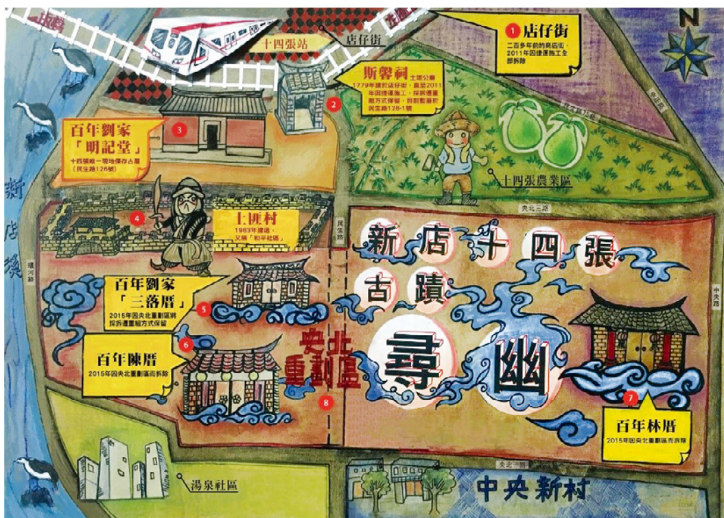
圖9 「新店十四張古蹟尋幽」社區地圖。

「新店十四張古蹟尋幽」地圖，由新北市新店區中山里辦公室里長及志工等5位繪製，談及都市更新與老屋保存的議題，於2016年「新店溪遊記—地圖工作坊」中，繪製在都市計畫央北重劃區土地開發背景下，於2011至2015年間已遭拆除的十四張地區老厝。