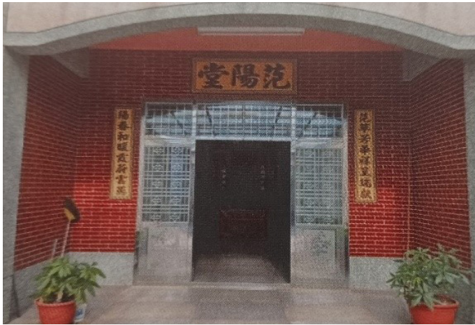
圖 3 鹿場鄒氏宗族新公廳外觀。