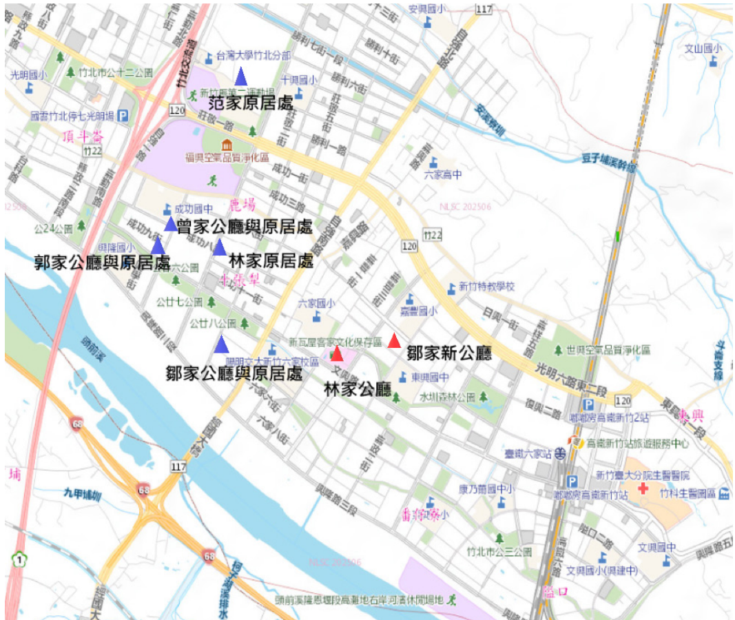
圖 6 鹿場各家族新舊公廳及原居住地位置圖。

復，於 2015 年 9 月 20 日竣工，整修竣工後，家族依然保有日常的祭祀。