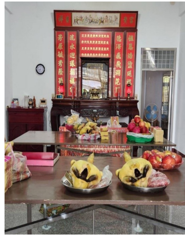
圖 4 鹿場鄒氏家族 2023 年中秋拜阿公婆。

選地遷建，舊公廳在民國 96 年（2007）4 月被夷為平地之後、最後落腳竹北中興里，外觀是現代化的一樓建築（參閱圖 3、圖 4）。