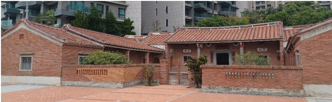
圖 5 汾陽堂（郭氏家族公廳）。

譜」的記載，後代作「郭氏族譜世代間距表」，分析其出自曖公系，為子儀公第十三世孫。福安公的八世孫天佑公（1216-1282），從福建上杭遷至廣東大埔百侯，並在此開基，興建祠堂「斯美堂」。之後的八百年間，其後裔在上杭有 1,500 人，大埔、饒平則有 20,000 多人。天佑公的曾孫通望公（約生於 1340 年），為在臺郭氏家族之一世祖，明朝初年遷居到大埔角寨背，建祠堂「善慶堂」。十世孫谷予公（1605-1660）於明朝末年自大埔角寨背遷移至平原東山，建祠「濟美堂」。十二世孫金溢公在清初（1693-1759）再由平原東山轉遷到高陂澄大畚。傳承至十七世克明公時，在道光年間以地理師身份，從廣東饒平大埔來臺開墾，他隻身一人揹著羅盤，渡過黑水溝到達臺灣，落腳於新竹六家十張犁。