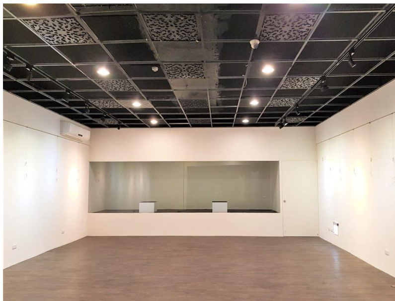
地點：傘架聚落建築區(2)第三特展室