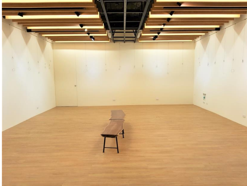
地點：傘架聚落建築區(1)第二特展室