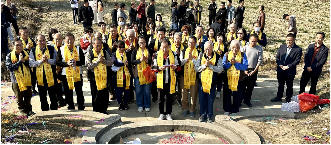
圖 14 廣東五世祖啓睿公墓。（資料來源：筆者自攝，拍攝日期：2025 年 3 月 22 日）