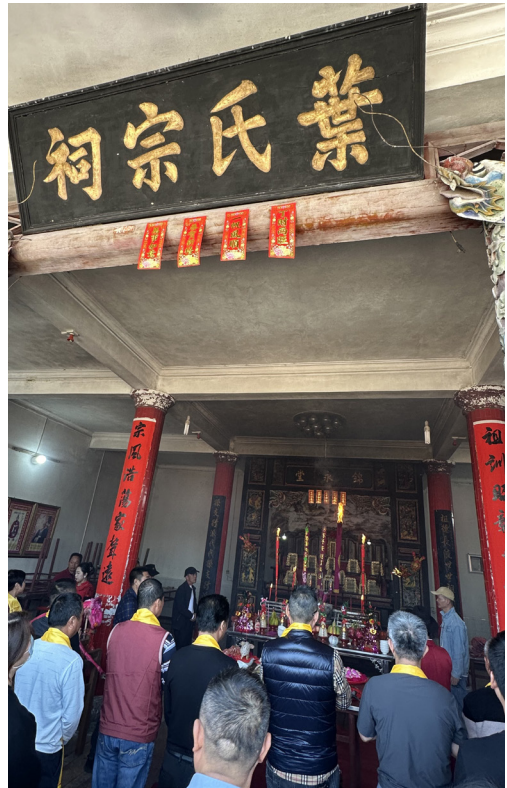
圖 12 葉氏宗祠祭祖典禮。

所謂血脈相連，即使我們與原鄉海天相隔，雖百年仍是脈絡相傳。筆者這次與宗親相會，終於驗證出葉五美家族在大陸原鄉就會說福佬、客家兩種語言。陸河宗親說：