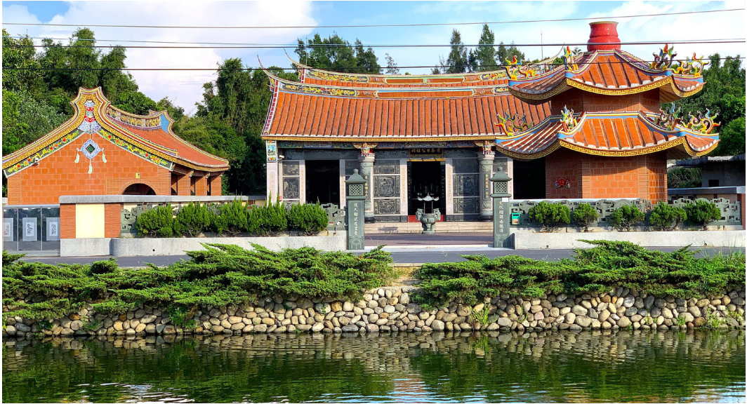
圖 2 於西元 2012 年重建之葉春日公祖祠。

祖在堂」的傳統，所以家中不設神明廳，祈福還願等重要節日，葉家人會前往隔壁永安里的保生宮參拜祈求。