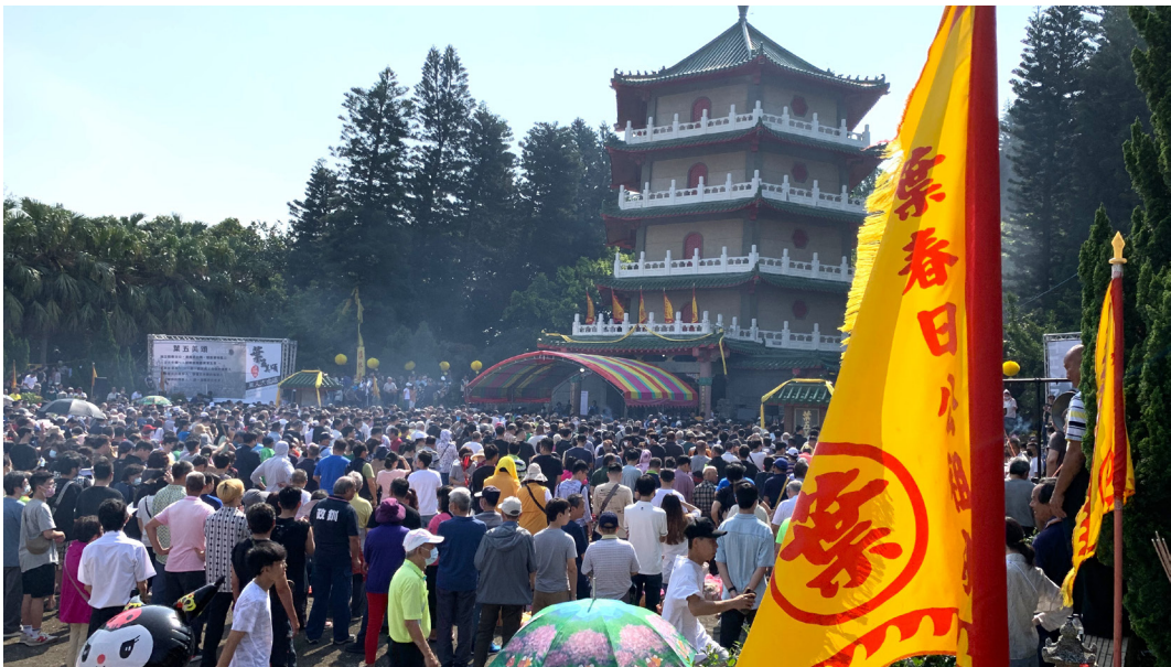
圖 6 葉五美清明節祭祀活動現場。(資料來源：筆者自攝，拍攝日期：2024 年 4 月 5 日)

三牲、素果、十二菜碗、發糕、紅龜粿、酒、茶等；葉家還有清明殺豬公祭拜的儀式，這習俗從民國 58 年（1969）或更早即已開始，因為葉家有一本從 1969 年即沿用至今（2026）的老帳本—「五美公春秋二祭輪值開費簿」，內容清楚記載每次清明及秋祭各項支出，其中包含了豬隻費用。葉家每年清明祭祀儀式從鳴炮及擊鼓聲響起時正式開始，首先由葉五美合唱團，帶領全體出席宗親合唱家族歌