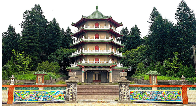
圖3 葉五美公祖塔。

客家祖塔是北部客家獨特的建築，客家人有所謂二次葬 7 的殯葬習俗。在祖塔未形成之前，各宗族都以墓制型式來處理二次葬的先人骨骸。臺灣光復初期，政府沒有墓葬等相