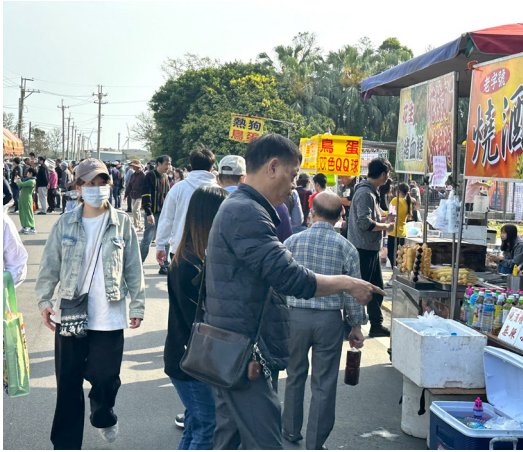
圖 7 清明節攤商活動現場。(拍攝日期：2025 年 4 月 5 日)