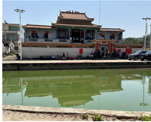
圖 11 廣東陸河葉氏宗祠。（資料來源：筆者自攝，拍攝日期：2025 年 3 月 22 日）

成，因此拿出新臺幣 30 萬元，交由當地宗親於 1991 年興建完成三座墓園。另外大陸祖堂原為啓睿公派下的二房天珙公及三房天璜公後代分開祭拜的兩棟泥磚屋建築，大房天璋公的後代葉春日因當年攜眷至臺灣發展不知去向，所以原鄉沒有其後人，故而未有祖堂。有鑑於此，臺灣葉五美裔孫發動樂捐新臺幣 260 萬元協助重建祖堂，並將啓睿公派下的 3 大房合併共同祭祀，1993 年廣東陸河葉氏宗祠落成完工。 14