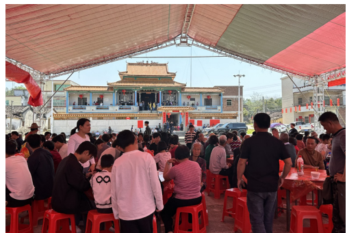
圖 13 陸河葉家午宴。（資料來源：筆者自攝，拍攝日期：2025 年 3 月 22 日）