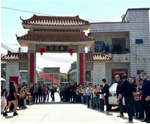
圖 10 寮前村歡迎場面。（拍攝日期：2025 年 3 月 22 日）