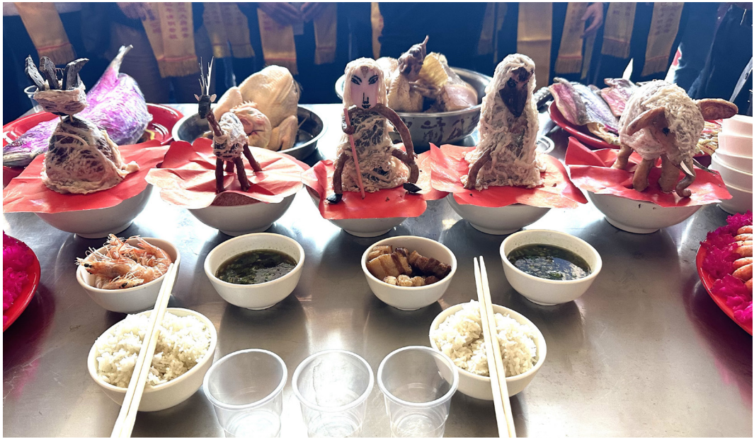
圖 17 陸河的看碗祭品。（資料來源：筆者自攝，拍攝日期：2025年3月22日）

因桉樹是紙漿的原料，價格好，但桉樹吸水性強，使得整個山頭土壤變得異常乾燥。另桉樹葉子含有毒素，枯葉掉落地面腐化後會對土壤會造成傷害，所以現有逐年減少種植的趨勢。這次回鄉親眼目睹原鄉環境的不易，終於了解春日公何以會攜家帶眷遠到未知的臺灣開墾發展，只因陸河生活真的不易。