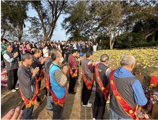
圖 4 清明節特鳳媽祭祀現場。(資料來源：筆者自攝，拍攝日期：2025 年 4 月 5 日)