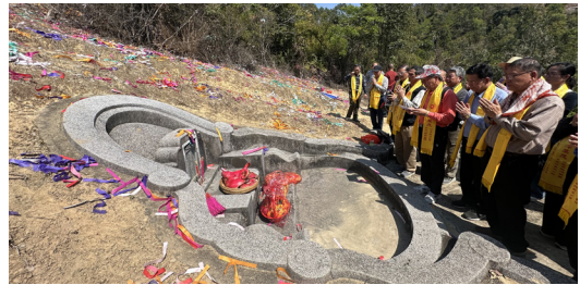
圖 16 廣東六世祖天璋公墓。（資料來源：筆者自攝，拍攝日期：2025 年 3 月 22 日）

因為我們葉家祖先來自福建同安，所以我們是福佬人，在家都是以福佬話做為主要交談的語言；但因相鄰村莊都住著客家人，為了溝通的需要，因此不論大人小孩都會說流利的客家話。 15