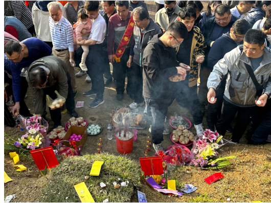
圖 5 特鳳媽墓前排隊敲蛋殼。(資料來源：筆者自攝，拍攝日期：2025 年 4 月 5 日)