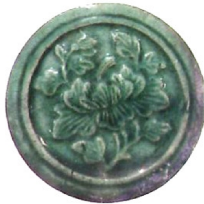
瓦當 nga \ dong \