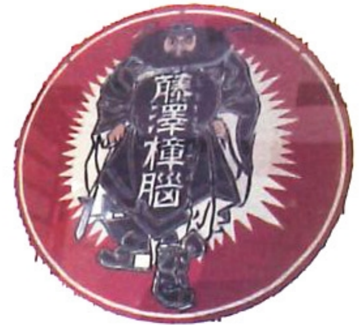
樟腦牌 zong \ no \ pai \