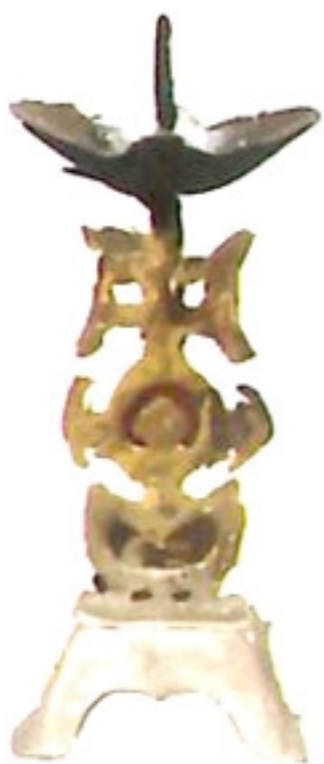
燭台 zug / toi /