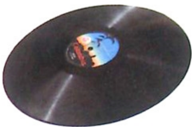
唱片 cong pien /