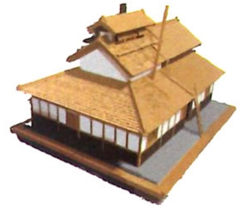
菸樓 Ien / leu /