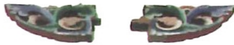
雀替 jiog \ ti ✓