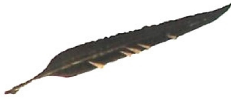
羽毛筆 i / mo / bid /