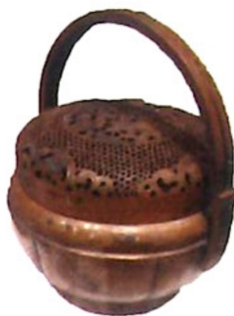
火爐 fo / cung /