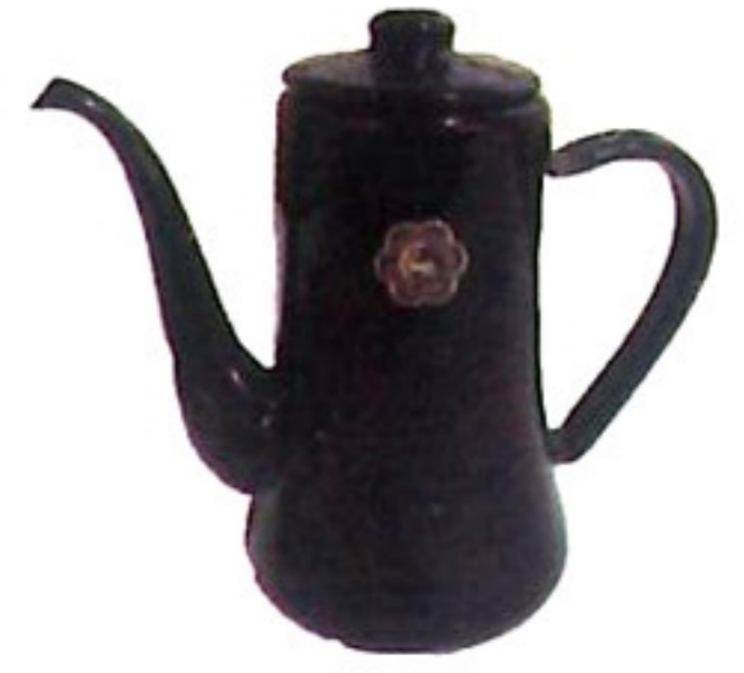
茶壺 ca / fu /