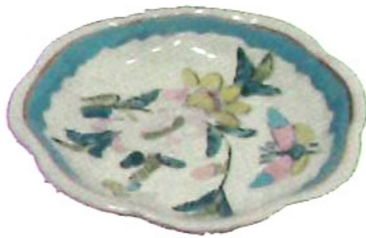
盤子 pan \ e \ ✓