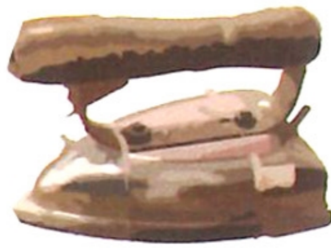
熨斗 iun deu \