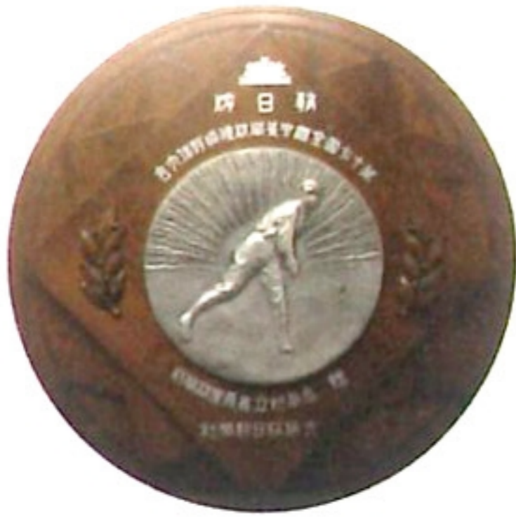
獎牌 jiong \ pai \