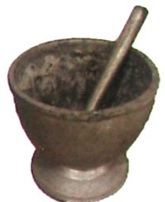
鉢 bad /