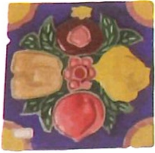
花磚 fa ' zon ' ✓