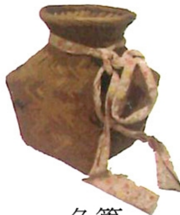
魚簍 ng / leu /