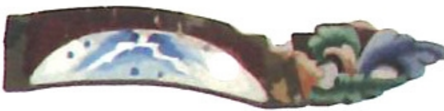
插角 cab \ gog \ ✓