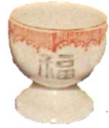
杯子 bi \ e \