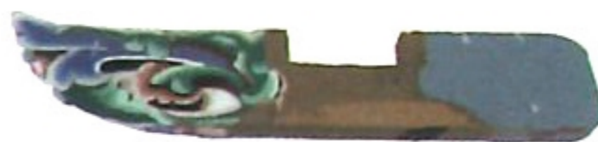
下十字拱 ha ' siib sii giung \ ✓