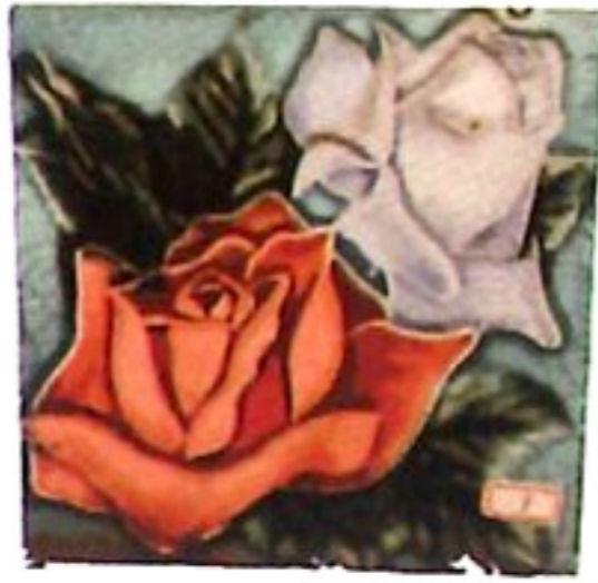
花磚 fa ' zon ' ✓