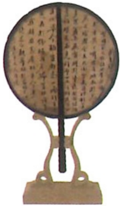
扇子 san e /