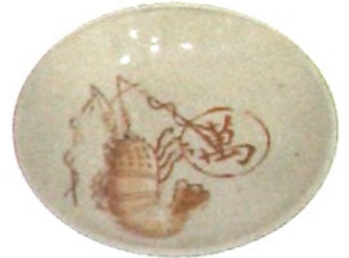
碗 von \ ✓