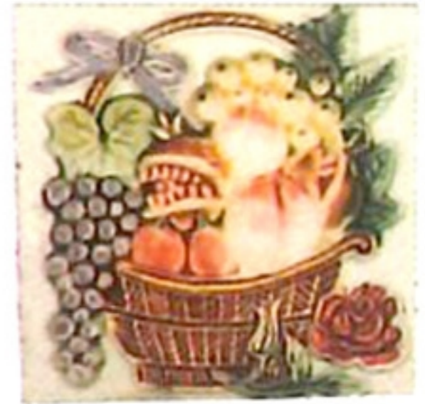
花磚 fa ' zon ' ✓