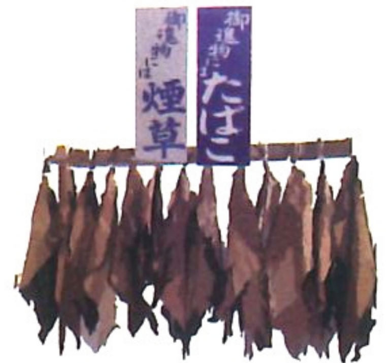
菸葉 Ien / iab