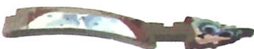
插仔 cab \ e \ ✓