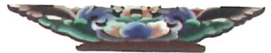
花座 fa ' co ✓