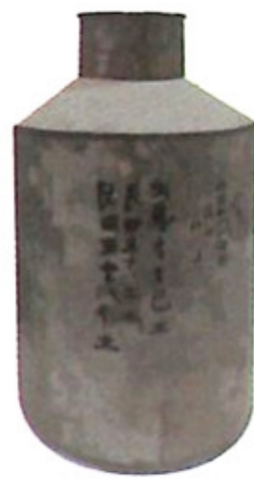
茶葉罐 ca / iab gon